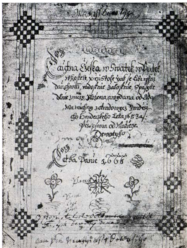
Titulní list „Loutny české“ (v opisu v pardubickém museu).